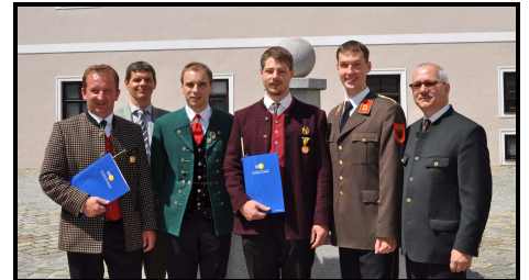
Kapellmeisterprüfung Teilnehmer BAG Krems